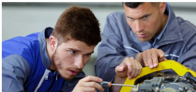
AUXILIAR DE MANTENIMENT I REPARACIÓ DE VEHICLES DE MOBILITAT PERSONAL