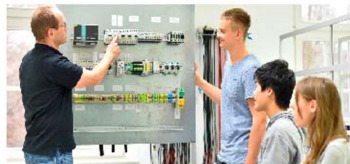
AUXILIAR DE MUNTATGES D'INSTAL·LACIONS ELECTROTÈCNIQUES D'EDIFICIS